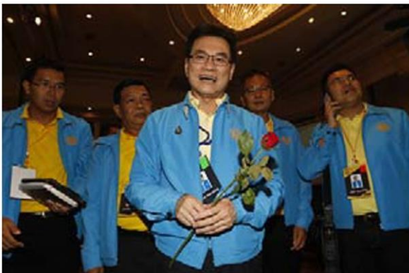
ปัญหาใหญ่น่าจะอยู่ที่พรรคประชาธิปัตย์ภายใต้การนำของ "อู๊ดดำ"ว่าจะตัดสินใจทางการเมืองอย่างไร