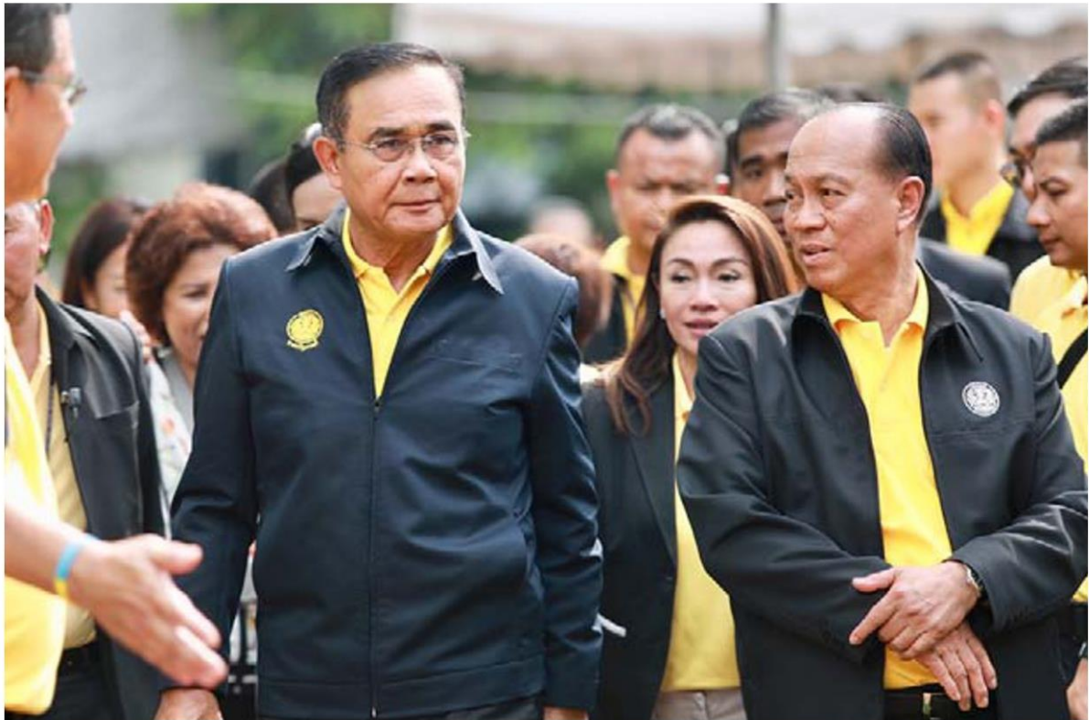
พล.อ.ประยุทธ์ จันทร์โอชา พล.อ.ประวิตร วงษ์สุวรรณ และพล.อ.อนุพงษ์ เผ่าจินดา ตามไฟที่ออกมาว่าจะนั่งเก้าอี้ตัวเดิมเป็นคำรบ 2