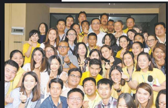
■ เลี้ยงสื่อทำเนียบ ■ พล.อ.ประยุทธ์ จันทร์โอชา นายกรัฐมนตรี จัดเลี้ยงอาหารสื่อมวลชนประจำทำเนียบรัฐบาล ถือเป็นกรรับประทานอาหารร่วมกันครั้งสุดท้ายก่อนจะมีรัฐบาลชุดใหม่ ที่ทำเนียบรัฐบาล เมื่อวันที่ 17 พ.ค.

รหัสข่าว: C-190518014004 (18 พ.ค. 62/06:15)