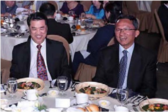
แกนนำสามมิตรคือ แม่สุริยะ จึงรุ่งเรืองกิจจะไม่รับตำแหน่ง แต่สมศักดิ์ เทพสุทิน อนุชา นาคาศัย คงไม่พลาดเก้าอี้เสนาบดี