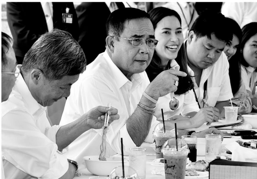
◀ หม่ากับสื่อ - พล.อ.ประยุทธ์ จันทร์โอชา นายกรัฐมนตรี รับประทานอาหารกลางวันร่วมกับสื่อมวลชนประจำทำเนียบรัฐบาล เปิดใจหลายเรื่องทั้งครอบครัว และอนาคตทางการเมือง เมื่อวันที่ 17 พ.ค.

พล.อ.ประยุทธ์กล่าวว่า ส่วนที่หลายฝ่ายกังวลเรื่องคนจะมีปัญหาถูกอภิปรายในสภานั้น การรับมือก็แข็งขัน เชื่อว่าแข็งแรงได้ ขออย่าใช้คำว่ากลัวหรือไม่ ส่วนบุคคลที่เหมาะสมจะเป็นประธานสภานั้น ต้องรู้เรื่องงานในสภา