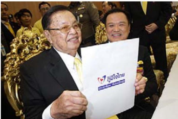
เสี่ยหนู-อนุทิน ชาญวีรกุล มาแน่ แต่จะได้กระทรวงอะไรนั้น น่าสนใจยิ่ง