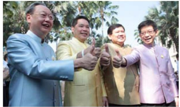
วิษณุ เครืองามและดร.สมคิด จาตุศรีพิทักษ์ ก็นั่งเป็นรองนายก-รัฐมนตรีที่เดิมเช่นกัน