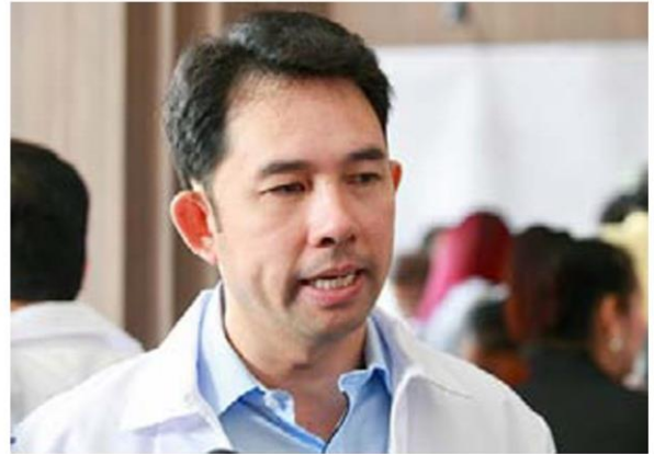
"เสี่ยติก" อิทธิพล คุณปลื้ม ก็ไม่น่าพลาด

จะเห็นได้ว่า ในขณะที่พรรคร่วมรัฐบาลพยายามต่อรอง "แบ่งเค้ก" แต่ภายในพรรคพลังประชารัฐก็จัดสรรที่นั่งรัฐมนตรี คู่ขนานกันไป สะท้อนภาพความมั่นใจในได้จัดตั้งรัฐบาล กลายเป็น เป็นการโยนความกดดันกลับไปยัง "ประชาธิปไตย-ภูมิใจไทย" ที่เลือกจะเล่นเกมถ่วงเวลาไปเรื่อยๆ คงไม่เป็นผลดี ด้วย "ผู้ กุมอำนาจ" ไม่คาย "เกรตเอ" ให้อย่างที่หวังอยู่ดี โดยเฉพาะ "กระทรวงคมนาคม" ที่ภูมิใจไทยมีความมุ่งมดปรารถนาเป็น ลำดับต้นๆ แถมยังทับซ้อนกับประชาธิปไตยที่แสดงเจตจำนง